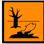
N Peligroso para el medio ambiente Dangerous for the environment