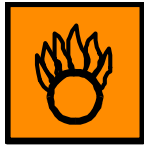
O Comburente Oxidizing

Símbolos: O: Comburente, Xn: Nocivo, N: Peligroso para el medio ambiente