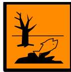
N Peligroso para el medio ambiente Dangerous for the environment