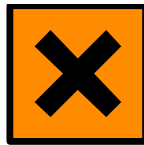
Xn Nocivo Nocive