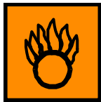
O Comburente Oxidizing

Símbolos: O: Comburente, Xn: Nocivo, N: Peligroso para el medio ambiente